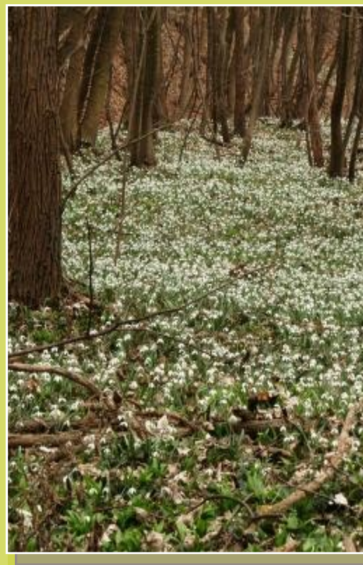
„Die Wüste“ kann es mit den bekanntesten englischen Schneeglöckchenparks aufnehmen.

Schneeglöckchen Schau(en) in der ‚Mannersdorfer Wüste‘