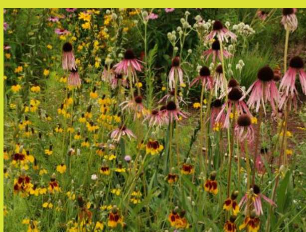
Ratibida columnifera, Bleicher Sonnenhut (Echinacea pallida), Kugeldistel (Echinops sp.) im Präriegarten der Gartenbauschule Kagran

Gärten mit schönen Staudenpflanzungen für den Hochsommer